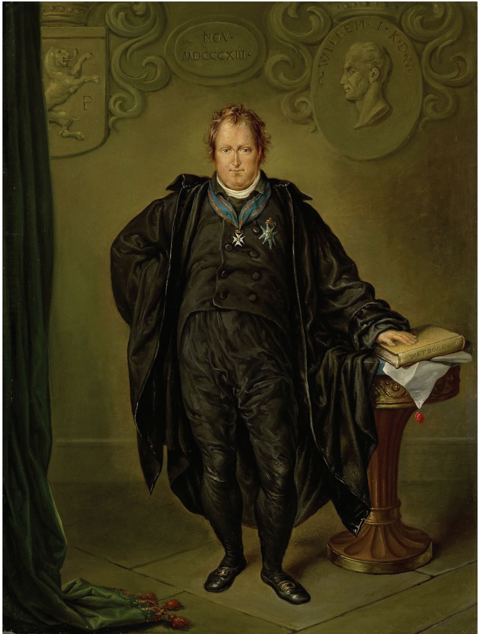
▲ Portret van Johan Melchior Kemper (1776-1824), rechtsgeleerde en staatsman, door David Pièrre Giottino Humbert de Superville, 1815. Tweede Kamerlid Kemper ontpopte zich tijdens de hier bestudeerde debatten tot een van de voornaamste Noordelijke verdedigers van het modern eigendomsconcept.