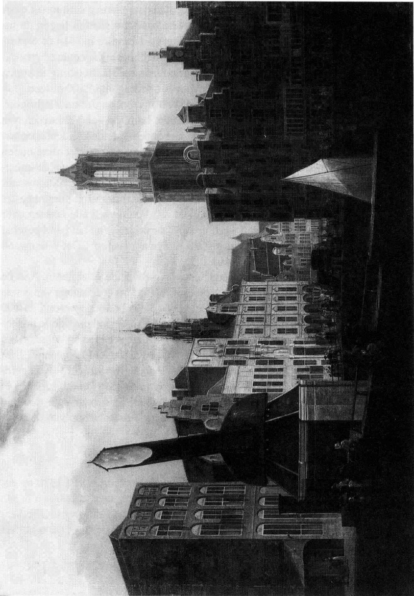
4 Pieter Jan Liender, De Stadhuisbrug , 1764, gezien vanaf de Beyerbrug. De huizen aan de werf zijn afgebroken, de huizen aan de Stadhuisbrug en de Oudegracht (Snippevlucht) spreiden hun voorname pracht ten toon. De handelsactiviteiten zijn duidelijk zichtbaar (Utrecht, Centraal Museum, 6169 a).