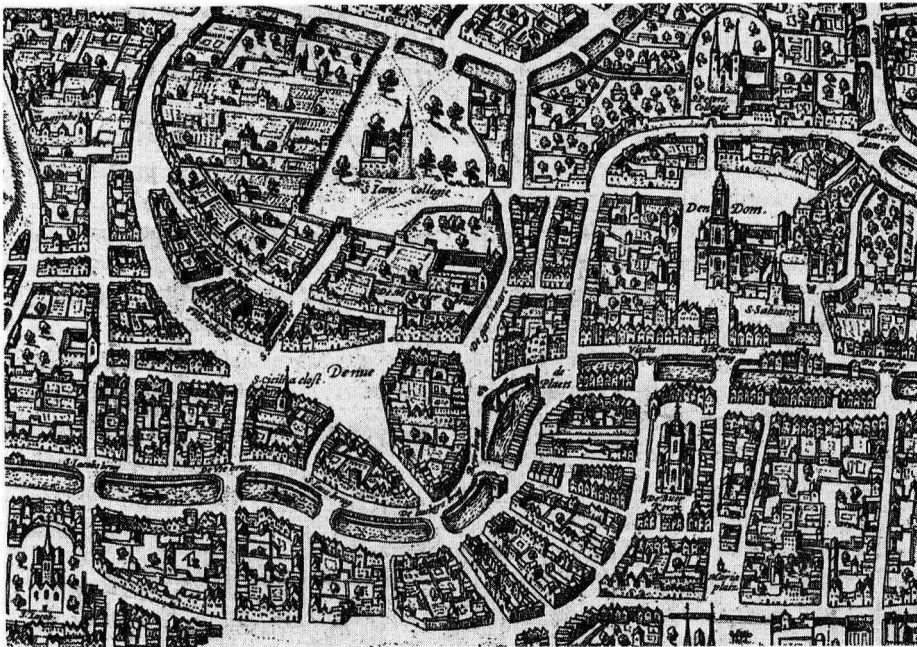
1 Detail van de plattegrond van de stad Utrecht, Trajectum (Frans Hogenberg, tussen 1569 en 1572, GAU, TA C 11.959). In de bocht van de Oudegracht tussen de Bakkerbrug en de Plaats ligt de Snippevlucht. De huizen aan de werf zijn goed zichtbaar. De buurt ligt in het bestuurlijke en economische hart van de stad, de Buurkerk is op een steenworp afstand.