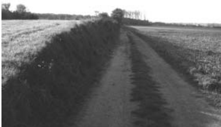
Figuur 3. Deels vergraven restant van de Graafjansdijk bij Bentille.