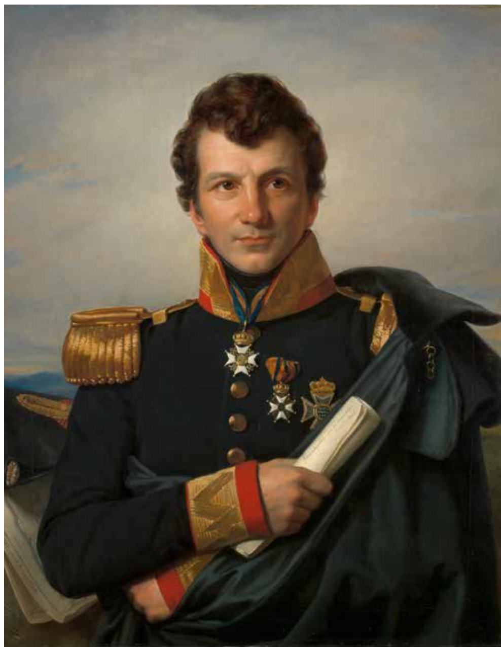
▲ Graaf Johannes van den Bosch (1780-1844), gouverneur-generaal van Nederlands-Indië, minister van koloniën.

Cornelis Kruseman, 1829. Rijksmuseum Amsterdam.